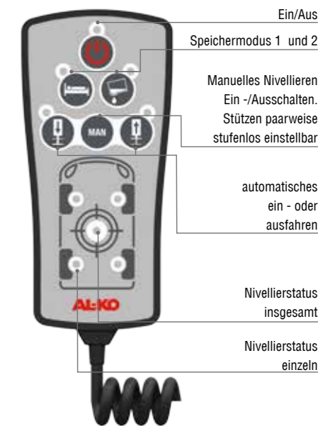
Ein/Aus Speichermodus 1 und 2 Manuelles Nivellieren Ein-/Aus-schalten. Stützen paarweise stufenlos einstellbar automatisches ein- oder ausfahren Nivellierstatus insgesamt Nivellierstatus einzeln