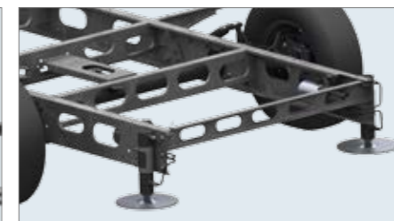
Einbaubeispiel Pumpe innen.