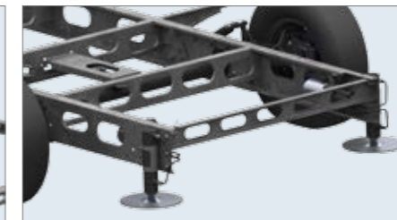
Einbaubeispiel Pumpe innen.