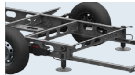
Einbaubeispiel Pumpe aussen. Hier empfehlen wir die optionale Aggregatabdeckung.

Autonomes Hydraulik-Aggregat direkt am Chassis. Kurze Hydraulikschläuche. Kein Aggregat im Innenraum mehr notwendig.